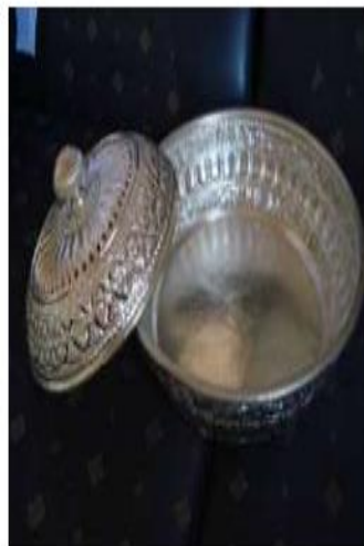
Bokor Perak dengan Penerapan Motif Kekarangan Papatran