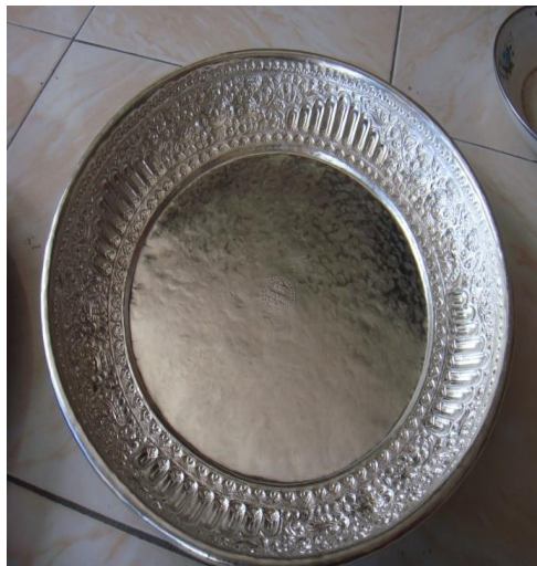
Produk Jadi Berupa Bokor